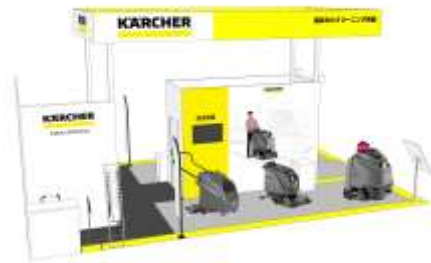
出展ブース イメージパース

今回のブースは、物流業界における清掃課題である床面洗浄を解決する製品を中心に展開いたします。中でも、見通しが良く小回りも利き、物流施設で活躍する立ち乗り式床洗浄機では最新モデル『BD 65/95 RS Bp DOSE』を、セミナー形式の実演も交えてご紹介いたします。その他にも、今後発売予定の搭乗式スーパー『KM 125/130 R G』をはじめ、高圧洗浄機や床洗浄機などの清掃機器を実機展示し、物流業界の効率的な 5S 活動に寄与する清掃ノウハウをご提案いたします。