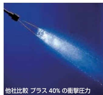
他社比較 プラス 40% の衝撃圧力