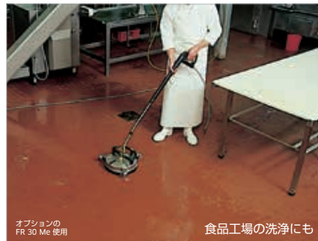
オプションのFR 30 Me 使用