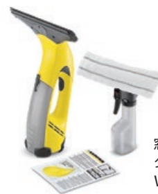
窓用バキューム クリーナー WV 50 Plus