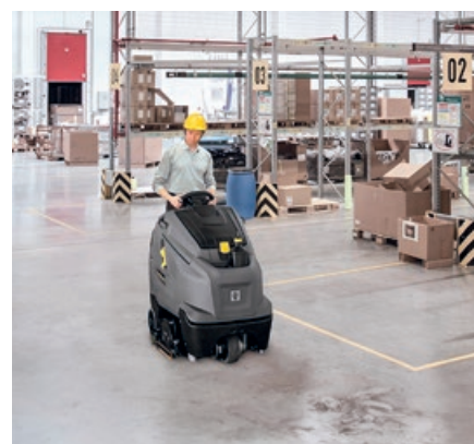
倉庫などの床洗浄に