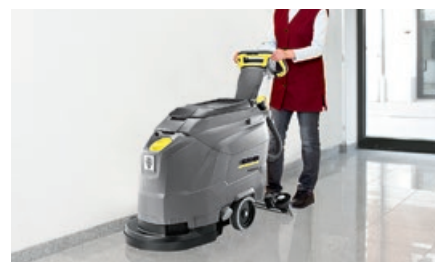
様々な施設の床洗浄に