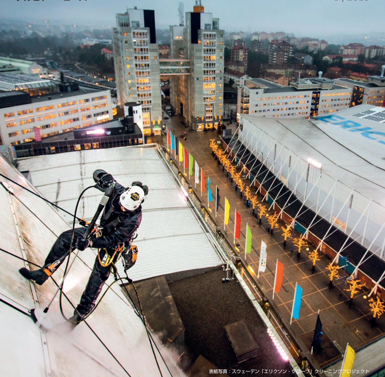
表紙写真：スウェーデン「エリクソン・クロープ」クリーニングプロジェクト