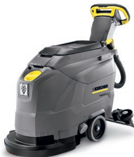
業務用手押し式床洗浄機「BD 43/25 C Bp」