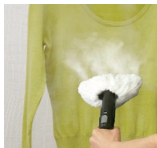
※衣類の絵表示をご確認のうえご使用ください。

約100℃のスチームで汚れを浮かせて落とすスチームクリーナーは、その蒸気で衣服のシワを伸ばすこともできます。ハンドブラシにカバーを取り付け（マイクロファイバー製がおすすめ）、スチームを出しながらアイロンの様に衣類の表面をゆっくりとすべさせます。すると高温のスチームによって繊維のつぶれやゆがみが解消され、ふっくらとした状態にしてくれます。スーツやジャケット（綿・ウール・ポリエステルなど）、ブラウス（綿・シルク・麻など）、コットンパンツ、ジーンズ、ニットといった衣類からカーテンまでご使用いただけます。