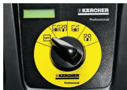
わかりやすい操作パネル