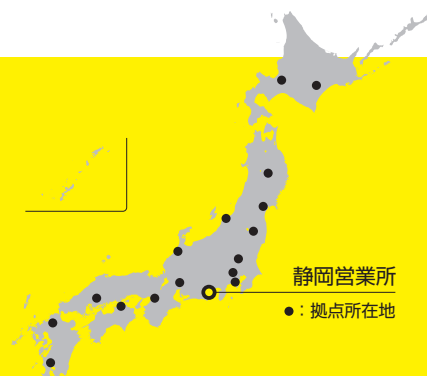
静岡営業所 ●: 拠点所在地

当いたします。営業拠点の充実により、これまで以上にお客様中心のサービスをご提供できるよう取り組んでまいります。