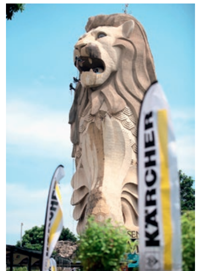
(写真上) アーヘン大聖堂 (写真下左) 洗浄途中のエリクソン・グローブ (写真下右) 高さ 37 mの巨大なマーライオン