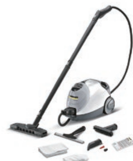
写真はスチームクリーナー SC 4.100 C