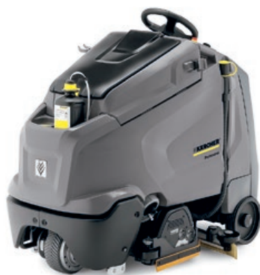
業務用立ち乗り式床洗浄機 「BR 65/95 RS Bp DOSE」 (ローラーブラシ、作業幅 650mm)

倉庫、工場の出荷場や配送センター、空港などの公共施設、大型のショッピングモールなど広範囲の床洗浄に適しています。