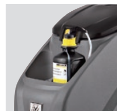
必要な分だけ洗浄剤を 自動で希釈する洗浄剤 節約システム DOSE