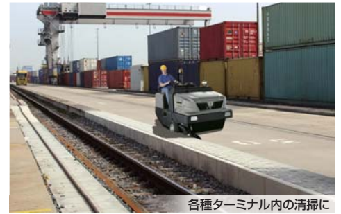
各種ターミナル内の清掃に