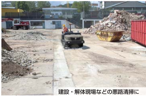
建設・解体現場などの悪路清掃に