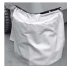
サイドブラシカバー