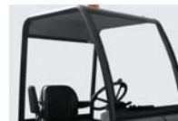
保護ルーフ(屋根のみ)