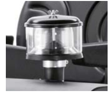
エンジン用プレフィルター