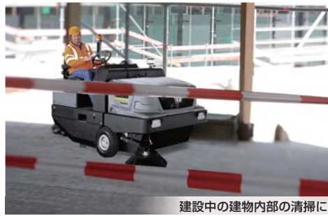
建設中の建物内部の清掃に