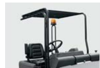
簡易保護ルーフ(屋根のみ)