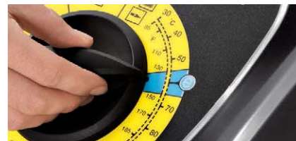
低燃費で環境にもやさしいエコモード搭載

エコモード機能により、一定の温度を保つことで燃料を節約し、清掃コストを抑えることができます。