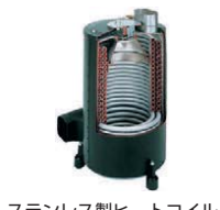
ステンレス製ヒートコイル (ヒートコイル: 3年保証)