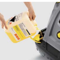
ガイド付の大型補給口