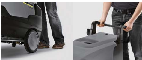
スムーズに移動できる大型タイヤ 取り回しが容易な持ちやすいハンドル

大型タイヤで広い清掃範囲をカバーします。持ちやすいハンドルのため取り回しも容易です。また、コンパクトなため、省スペースで設置できます。