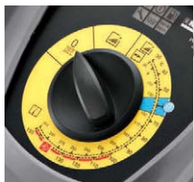
操作しやすい大型ダイヤル

作業内容が一目で分かるイラスト入りダイヤルで、どなたでも操作ができます。また、洗浄剤と燃料の補給口が大きく、液ダレを防ぎ床をよごしません。