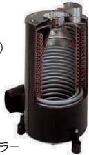
ステンレス製 ヒートコイルボイラー