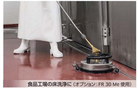
食品工場の床洗浄に（オプション：FR 30 Me 使用）