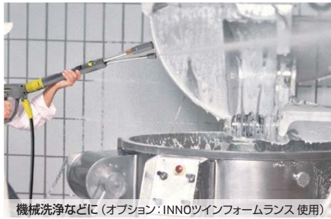
機械洗浄などに（オプション：INNOツインフォームランス 使用）