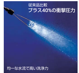
従来品比較 プラス40%の衝撃圧力