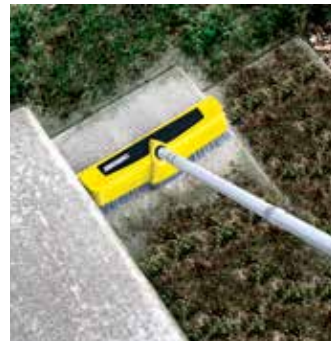
Powerschrubber PS 40