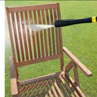
Multi Power Jet