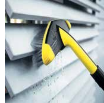
Weiche Waschbürste WB 60