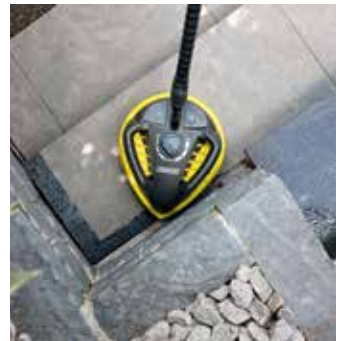
T-Racer T 450

Der Powerschrubber PS 40 verfügt über drei Hochdruckdüsen und eignet sich ideal für die Treppen- und Kantenreinigung.