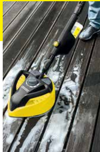
T-Racer T 550

Unsere T-Racer reinigen sowohl harte Flächen wie Stein und Beton als auch empfindlichere Oberflächen (z. B. Holz). Ein ergonomischer Handgriff sorgt dafür, dass sich auch vertikale Flächen wie Garagentore optimal säubern lassen.