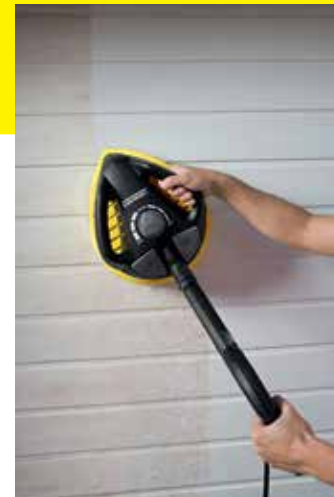
T-Racer T 450