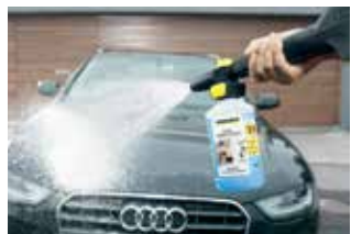
Schaumdüse Connect 'n' Clean

Mit der Powerbürste WB 150 oder der rotierenden Waschbürste WB 100 lassen sich Fahrzeuge besonders effizient und zugleich schonend reinigen. Die Powerbürste hat eine praktische Dreiecksform und arbeitet mit Hochdruck in Kombination mit manuellem Bürstendruck. Die Reinigungswirkung der rotierenden Waschbürste basiert auf einem rotierenden Bürstenkopf und manuellem Bürstendruck.