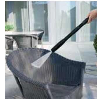
Vario Power Jet

Grober Schmutz wird mit Hilfe des Universalreinigers effektiv gelöst und abgespült. Das Reinigungsmittel wird über das Vario Power Jet im Niederdruck aufgetragen. Nachdem der Universalreiniger und der gelöste Schmutz gründlich abgespült wurden, wird der Glass Finisher im Niederdruck aufgebracht und anschließend mit Hochdruck abgespült. Die Scheiben des Wintergartens trocknen streifenfrei, sofern das Glas nicht beschichtet ist.