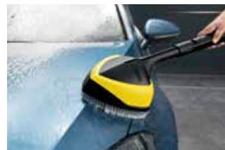
Powerbürste WB 150