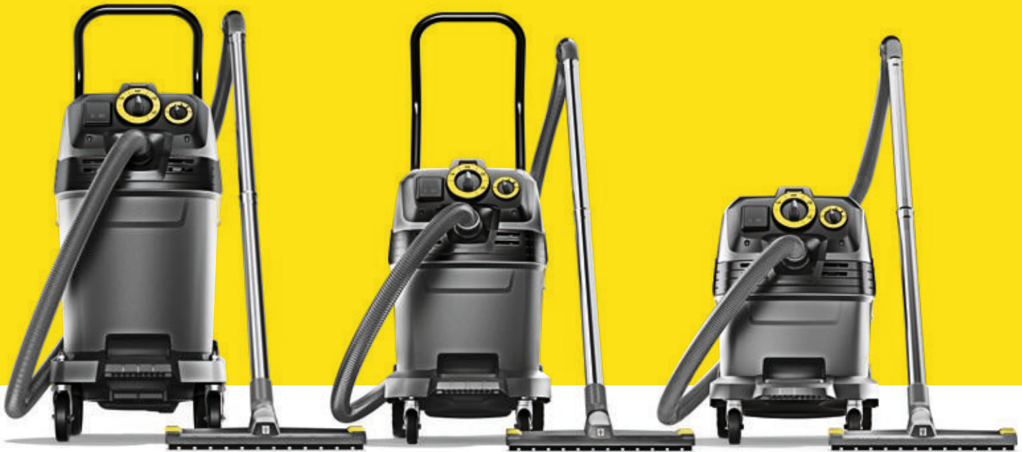
NT 50/1 Tact Te L

In unserer Produktfamilie Nass-/Trockensauger steckt unsere jahrzehntelange Erfahrung. Und die von vielen professionellen Anwendern. Wir haben die neuen NT Tact gemeinsam mit Handwerkern, Industrieanwendern, Fahrzeugaufbereitern und anderen Berufsgruppen entwickelt. Damit Sie für jeden Zweck einen einsatzgerechten NT Tact haben.