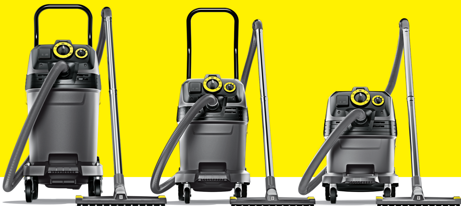
NT 50/1 Tact Te L

Våra Tact-grovdammsugare rymmer årtionden av erfarenhet hos professionella användare. Vi har utvecklat de nya NT Tact i samarbete med hantverkare, industri användare, fordonsvårdare och andra yrkesgrupper. Detta för att du ska ha en NT Tact som passar för varje ändamål.