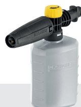
Pěnovací tryska pro nanášení čisticích prostředků FJ 6 obj.č. 2.643-147.0