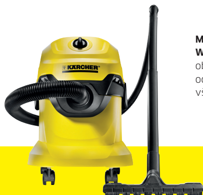
Multifunkční vysavač WD 4 obj.č. 1.348-110.0 odstraní nečistoty všeho druhu.

Jakmile je v přístroji dosaženo maximálního množství odsáté vody, je automaticky zastavena funkce sání. Díky odnímatelné nádobě na čistou vodu je plnění a vylévání vody možné bez toho, aby se musel otevírat celý přístroj. Mimochodem, tepovače Kärcher mohou být využívány také jako multifunkční vysavače.