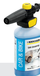
Pěnovací tryska Connect 'n' Clean FJ 10 C s autošamponem obj. č. 2.643-144.0