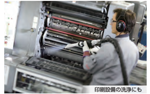
印刷設備の洗浄にも