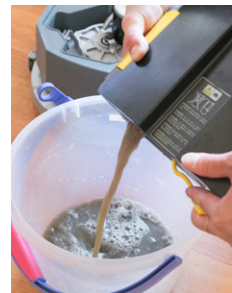
タンクに吸水された汚水

「サイズがコンパクトで、充電式なのもうれしいですね。医療室は狭いうえに、さまざまな医療機器があるため、大掛かりな掃除は難しいのです。スタッフの人数や清掃できる時間が限られるので、短時間で効率よく清掃する必要もありました。『BD 30/4 C Bp』は出し入れも楽ですし、コードがないので場所を選ばず清掃できます。小回りが利くので奥まった場所も掃除がしやすく、さらにパワーもあり一度で掃除が済みます。保管にも場所を取らないので小規模の事業所や動物病院、ペットショップなどでは動物にも嬉しい利用価値の高い掃除道具と言えるでしょう」