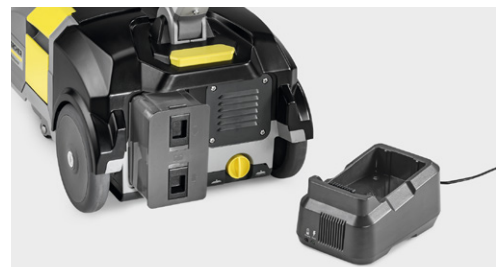
着脱可能なバッテリー