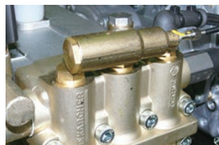
エンジン速度調整機能