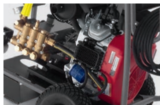
信頼のホンダ製エンジン

※1) 作業をしていない時にエンジンの回転を抑え、エンジンへの負荷を軽減することでトラブルを防ぎます。