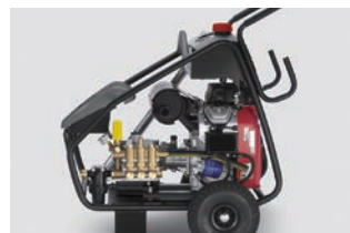
本体ユニットを守る頑丈なフレーム