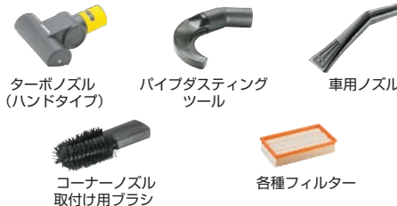
ターボノズル (ハンドタイプ)

オプションアクセサリーは多種多様です。汚れの場所や、状況に応じて、最適なアクセサリーをお選びいただけます。