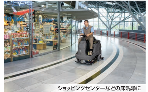
ショッピングセンターなどの床洗浄に