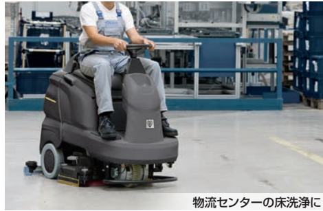
物流センターの床洗浄に