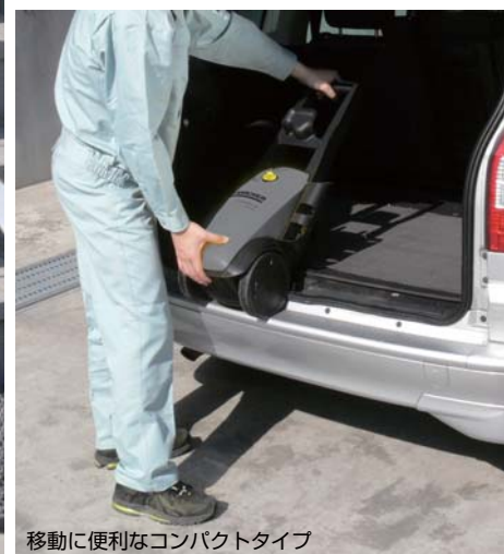
移動に便利なコンパクトタイプ