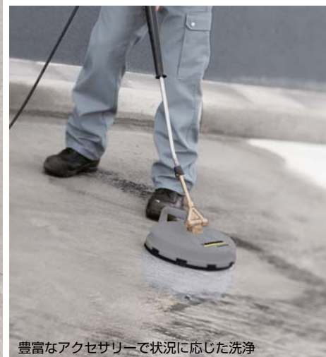
豊富なアクセサリで状況に応じた洗浄