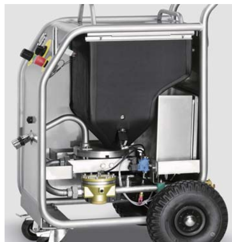
凍結を防止する設計で連続作業が可能