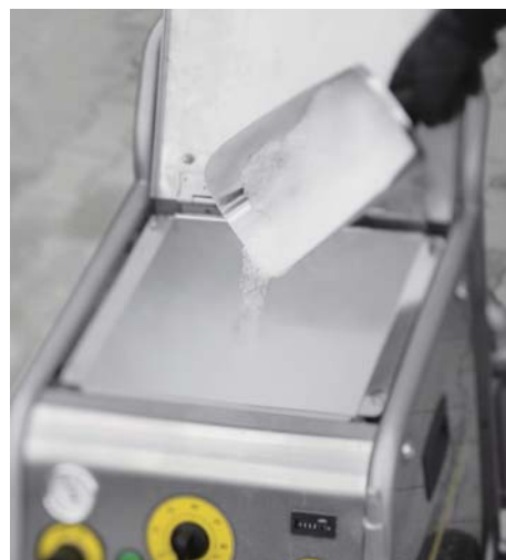
汚水処理の必要がない環境にやさしい洗浄