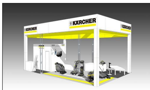
『クリーンEXPO 2014』ブースイメージ

「クリーンEXPO 2014」ブースでは、太陽電池モジュールに付着した汚れを効率的に洗浄できる高圧洗浄機用アクセサリーの実演を、実際の太陽電池モジュールを用いて行います。他にも、商業施設や駅向けには床洗浄機、マンション共用部やゴミ置き場での使用を想定した 100V 仕様の電源の取りやすい高圧洗浄機や、ホテルでのベッドバグ駆除に効果的なスチームクリーナーなど、当社ならではの総合的な清掃機器をご提案します。