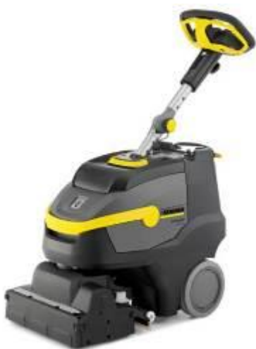
業務用バッテリー式小型床洗浄機 「BR 35/12 C Bp」

主な清掃シーンとして、店舗、ホテル、レストラン、スーパー、コンビニ、倉庫、工場、その他施設での床洗浄における、軽度な汚れの日常的な清掃用や、電源の確保しにくい場所(店舗内、エントランス、エレベーター)や、棚や什器など設置物の入り組んだ場所で使用を想定しております。