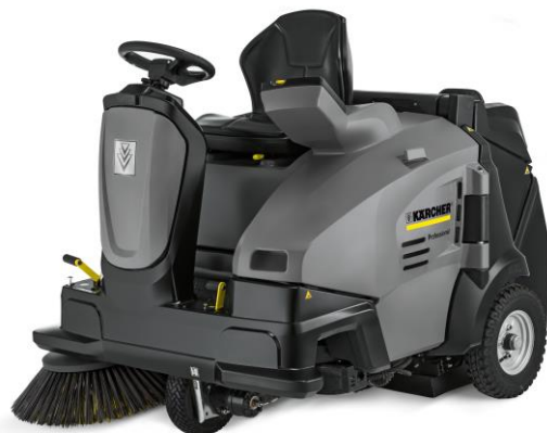
業務用搭乗式バキュームスイーパー『KM 105/110 R P』

当製品は、倉庫・工場での床清掃を中心に、ショッピングモールや駅ビルテナント・共用部、空港など公共での床清掃など幅広い用途を想定しています。