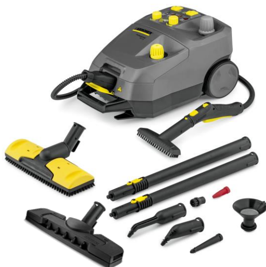
業務用スチームクリーナー「SG 4/4」

主な清掃シーンとして、各種工場での設備・機械・パーツの洗浄、自動車のシートなど車内洗浄、イス・壁・カーペット等のヤニや油除去、飲食店・スーパーの厨房洗浄、加えて水回りやドアノブ、ベビーシート(おむつ交換台)等の洗浄・除菌を想定しています。