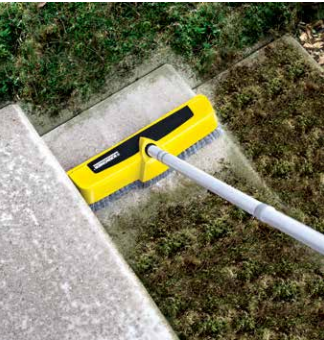
Powerschrubber PS 40