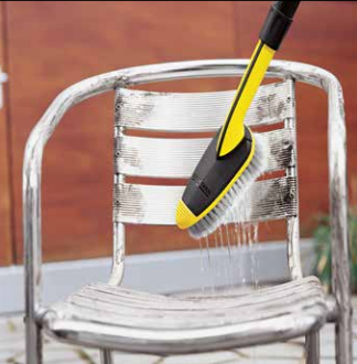
Waschbürste WB 50

Gartenwerkzeuge lassen sich mit Hilfe des Dreckfräasers mit rotierendem Punktstrahl auch von hartnäckigstem Schmutz befreien. Bei verschmutzten Gartenmöbeln empfehlen wir das Vario Power Jet mit stufenloser Druckregulierung vom Niederdruck-Reinigungsmittelstrahl bis zum Hochdruckstrahl. In Verbindung mit dem passenden Reinigungsmittel (Holz- bzw. Kunststoffreiniger) können noch bessere Ergebnisse erzielt werden. Außerdem empfehlenswert: Das Multi Power Jet mit fünf Strahlarten (Reinigungsmittelstrahl, Hochdruckflachstrahl, Rotordüse, Punktstrahl, breiter druckreduzierter Strahl). Zusätzliche Reinigungswirkung lässt sich durch Schrubben mit der weichen Waschbürste WB 50 mit oberflächenschonenden Borsten erzielen.