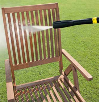
Multi Power Jet