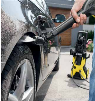
Vario Power Jet Short 360°