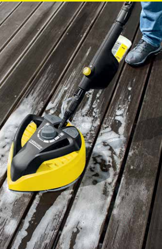
T-Racer T 550

Unsere T-Racer reinigen sowohl harte Flächen wie Stein und Beton als auch empfindlichere Oberflächen (z. B. Holz). Ein ergonomischer Handgriff sorgt dafür, dass sich auch vertikale Flächen wie Garagentore optimal säubern lassen.