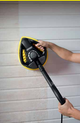
T-Racer T 450