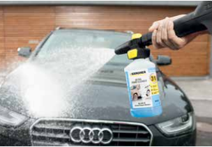
Schaumdüse Connect 'n' Clean

Mit der Powerbürste WB 150 oder der rotierenden Waschbürste WB 100 lassen sich Fahrzeuge besonders effizient und zugleich schonend reinigen. Die Powerbürste hat eine praktische Dreiecksform und arbeitet mit Hochdruck in Kombination mit manuellem Bürstendruck. Die Reinigungswirkung der rotierenden Waschbürste basiert auf einem rotierenden Bürstenkopf und manuellem Bürstendruck.