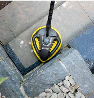
T-Racer T 450

Der Powerschrubber PS 40 verfügt über drei Hochdruckdüsen und eignet sich ideal für die Treppen- und Kantenreinigung.