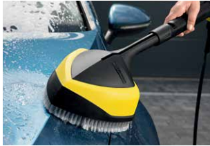
Powerbürste WB 150