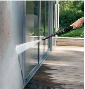
Vario Power Jet

Grober Schmutz wird mit Hilfe des Universalreinigers effektiv gelöst und abgespült. Das Reinigungsmittel wird über das Vario Power Jet im Niederdruck aufgetragen. Nachdem der Universalreiniger und der gelöste Schmutz gründlich abgespült wurden, wird der Glass Finisher im Niederdruck aufgebracht und anschließend mit Hochdruck abgespült. Die Scheiben des Wintergartens trocknen streifenfrei, sofern das Glas nicht beschichtet ist.