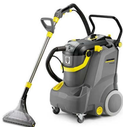
業務用カーペットリンスクリーナー 「Puzzi 30/4」

主な清掃シーンとして、ビル、ホテル、会議場、映画館、遊技場、飲食店などの広い範囲のカーペットや、自動車、電車などのシート洗浄、食べこぼしや飲みこぼしによるシミ、土・ホコリなどによる汚れや黒ずみの除去を想定しています。